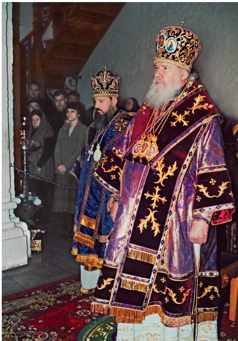
Святейший Патриарх Алексий II за богослужением в Богородице-Рождественском монастыре. Москва. Великий пост. 2003 г.