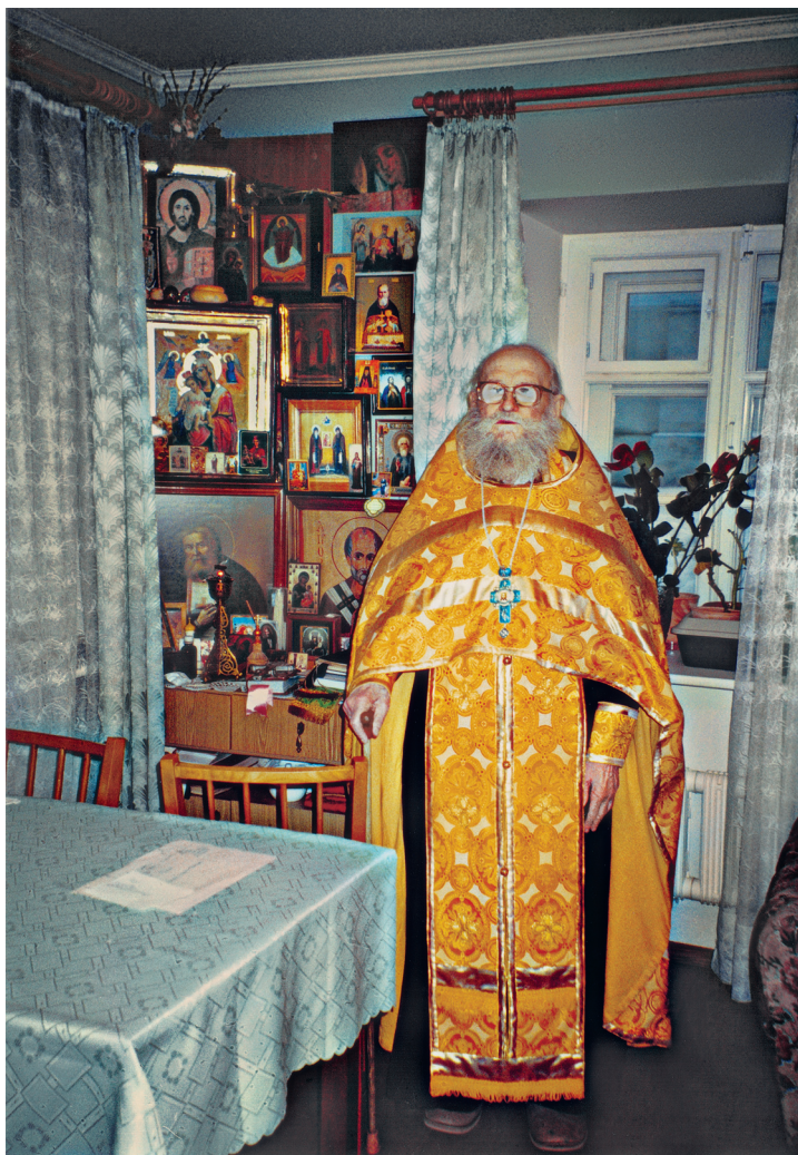
Батюшка в своей келье в день 90-летия. Богородице-Рождественский монастырь. Москва. 2004 г.