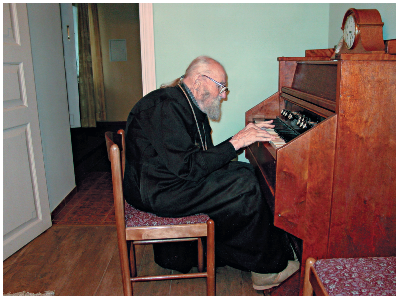
За фисгармонией в своем кабинете. Богородице-Рождественский монастырь. Москва. 2004 г.