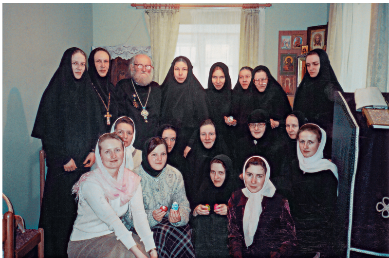
Батюшка с насельницами и певчими Богородице-Рождественского монастыря. 2004 г.