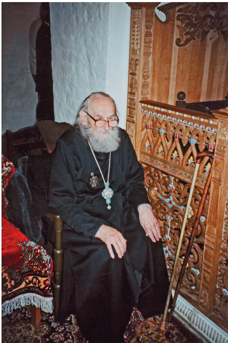
На богослужении в день Рождества Божией Матери. Богородице-Рождественский монастырь. Москва. 2003 г.