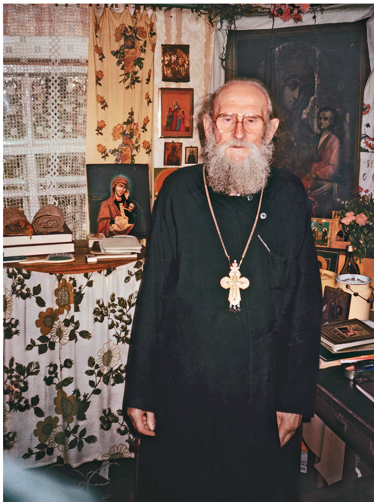
В красном углу своего дома в Малых Толбичах. 1993 г.